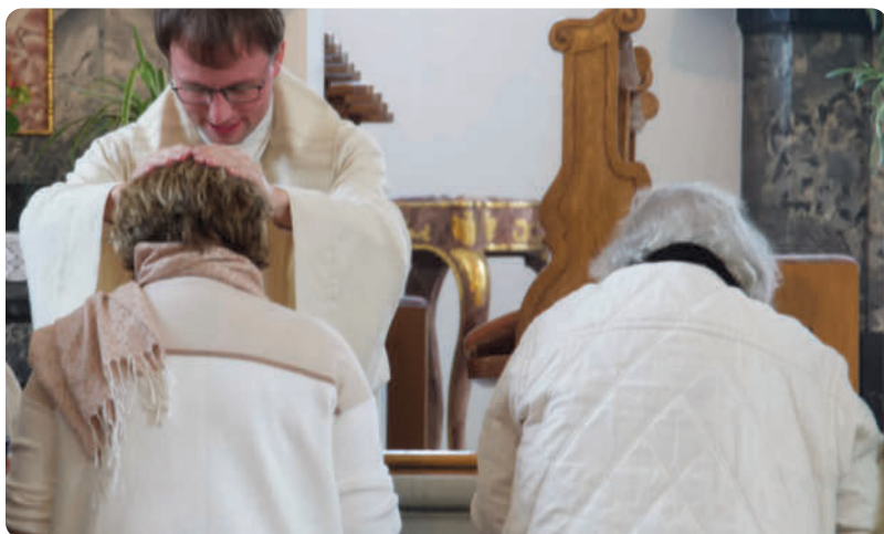
Am frühen Nachmittag folgte die traditionelle Primizandacht, am Ende derer jeder den Einzelprimizsegens empfangen konnte. So ging ein fröhlicher und eindrücklicher Tag zu Ende