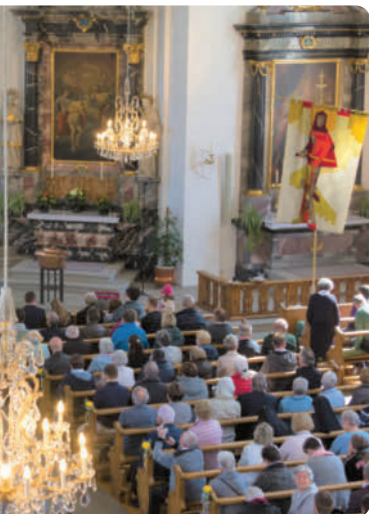
Chöre aus Davos und Buochs schlossen sich dafür extra zusammen und führten mit einem Ad-hoc-Orchester Joseph Haydns Kleine Orgelsolomesse auf