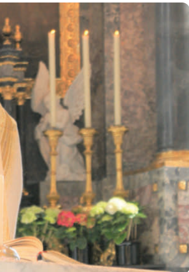
Man sagt, es sei wert, sich ein Paar Schuhe kaputt zu laufen, um einen solchen Segen zu empfangen