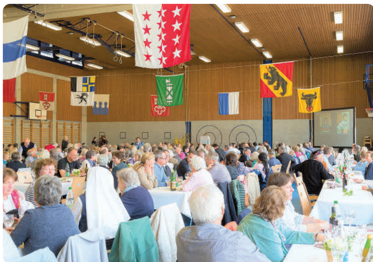
Im Anschluss an die Messe und den Apéro, der draussen bei strahlendem Sonnenschein stattfand, waren alle Anwesenden zum Mittagessen eingeladen. Viele Grussworte wurden gehalten, u.a. vom Dekanat und der Landeskirche. Es wurde gelacht, geplaudert, alte Bekanntschaften gepflegt und neue Bekanntschaften geschlossen