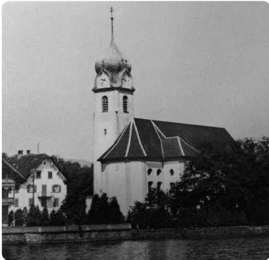
Die Pfarrkirche auf einer alten Aufnahme (zwischen 1890 und 1936), aus der Sammlung Reproduktion alter Postkarten von Beckenried zu Gunsten der Kirchenrenovation

Der ehemalige Kirchmeier Gerhard Baumgartner hat die Idee von Sakristan Hans Käslin zur Würdigung dieses Geschehens aufgegriffen. Am 24. Juni 2022 bildete sich eine Arbeitsgruppe mit dem Ziel, in Verbindung mit diesem 700 Jahr-Jubiläum die Kirchengeschichte Beckenrieds aus dem Blickfeld «Kirche gestern – heute – morgen»