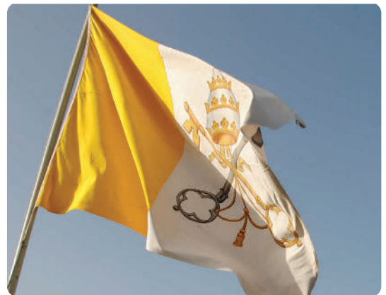
Gelb-Weiss, Tiara und Petruschlüssel: Diese Flagge weist auf eine Einrichtung des Heiligen Stuhls hin, wie eine Nuntiatur